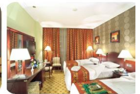
HOTEL MADINAH (6D | 5N) Hotel Leader Al Muna kareem *5/ setaraf, Madinah