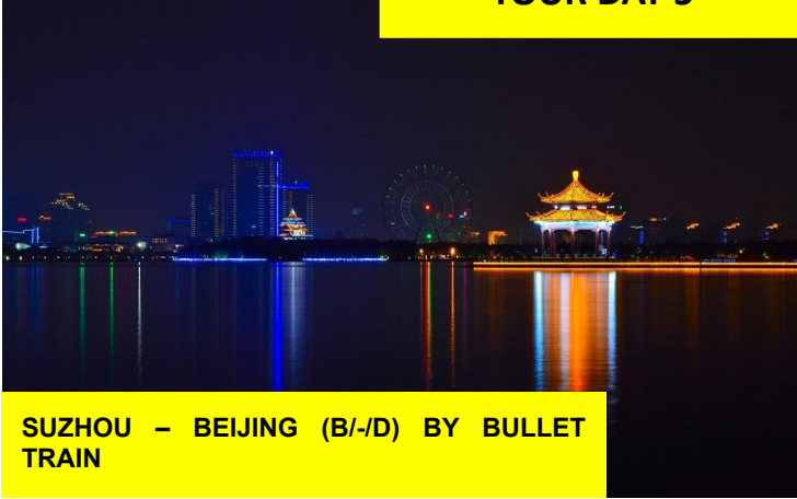
SUZHOU – BEIJING (B/-/D) BY BULLET TRAIN