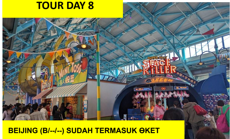
BEIJING (B/--/--) SUDAH TERMASUK ØKET