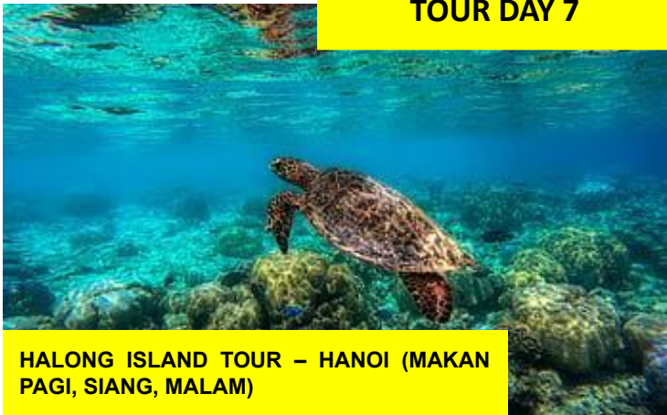
HALONG ISLAND TOUR – HANOI (MAKAN PAGI, SIANG, MALAM)