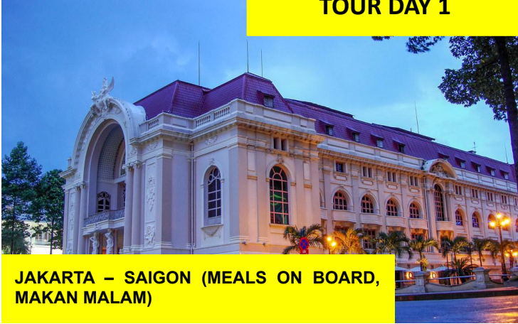
JAKARTA – SAIGON (MEALS ON BOARD, MAKAN MALAM)