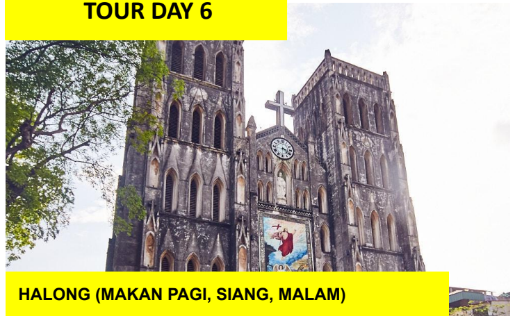
HALONG (MAKAN PAGI, SIANG, MALAM)