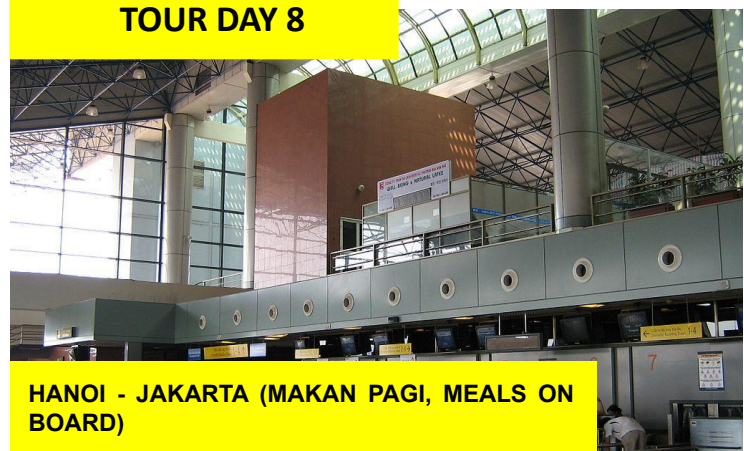
HANOI - JAKARTA (MAKAN PAGI, MEALS ON BOARD)