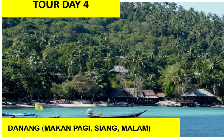
DANANG (MAKAN PAGI, SIANG, MALAM)