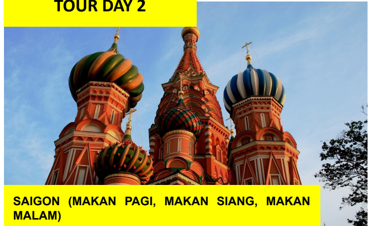
SAIGON (MAKAN PAGI, MAKAN SIANG, MAKAN MALAM)