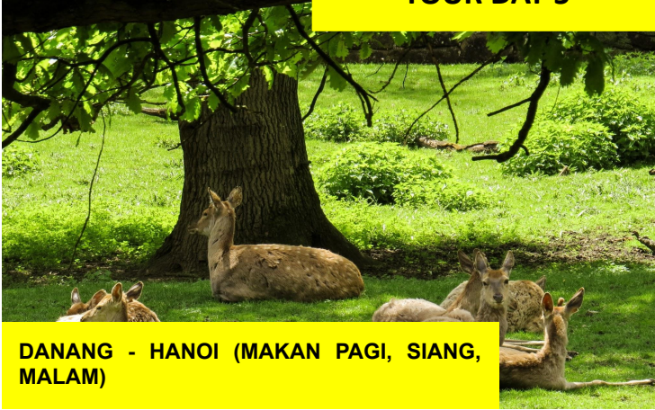
DANANG - HANOI (MAKAN PAGI, SIANG, MALAM)