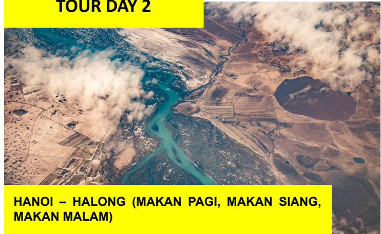
HANOI – HALONG (MAKAN PAGI, MAKAN SIANG, MAKAN MALAM)