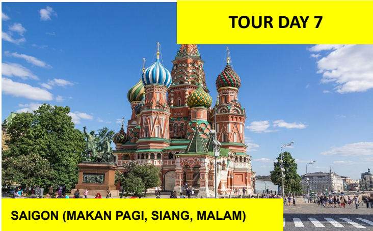
SAIGON (MAKAN PAGI, SIANG, MALAM)