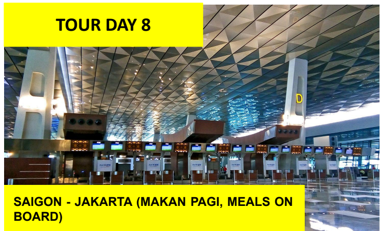
SAIGON - JAKARTA (MAKAN PAGI, MEALS ON BOARD)