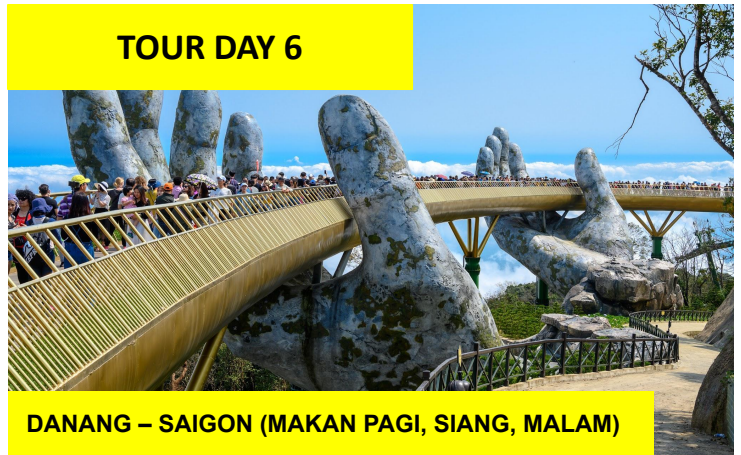
DANANG – SAIGON (MAKAN PAGI, SIANG, MALAM)