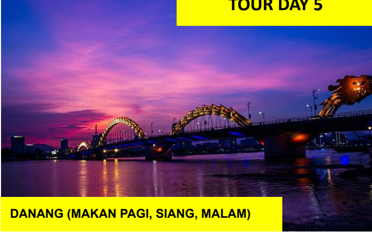
DANANG (MAKAN PAGI, SIANG, MALAM)