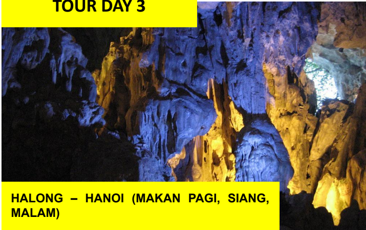
HALONG – HANOI (MAKAN PAGI, SIANG, MALAM)