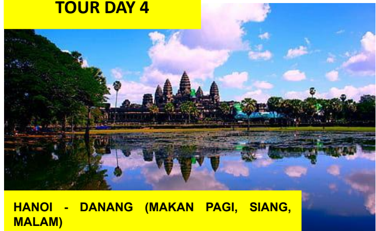
HANOI - DANANG (MAKAN PAGI, SIANG, MALAM)