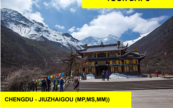
CHENGDU - JIUZHAIGOU (MP,MS,MM))