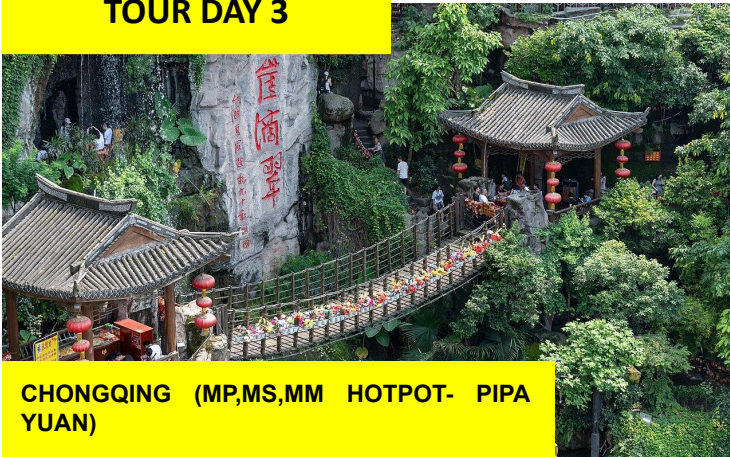
CHONGQING (MP,MS,MM HOTPOT- PIPA YUAN)