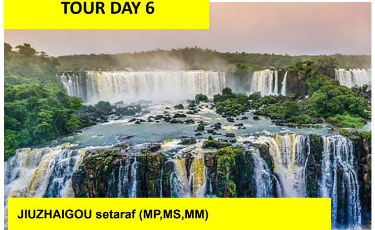
JIUZHAIGOU setaraf (MP,MS,MM)