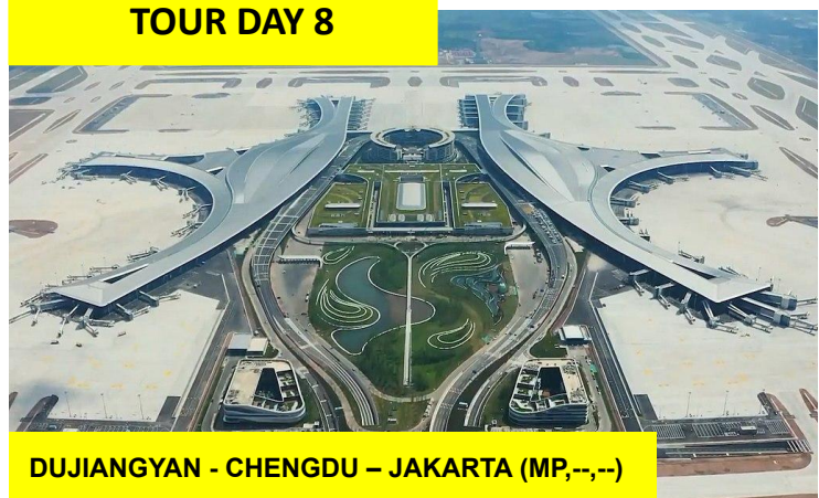
DUJIANGYAN - CHENGDU – JAKARTA (MP,--,--)