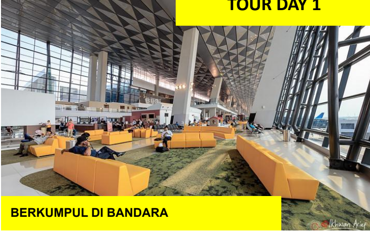
BERKUMPUL DI BANDARA