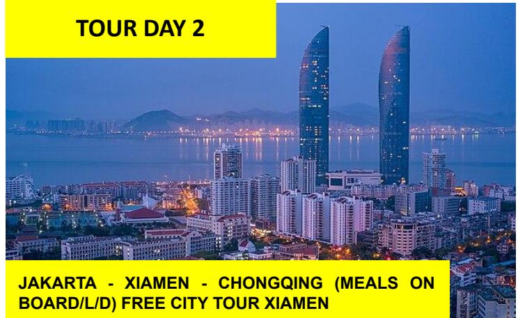
JAKARTA - XIAMEN - CHONGQING (MEALS ON BOARD/L/D) FREE CITY TOUR XIAMEN