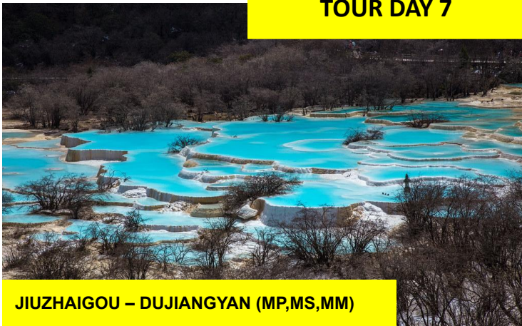
JIUZHAIGOU – DUJIANGYAN (MP,MS,MM)