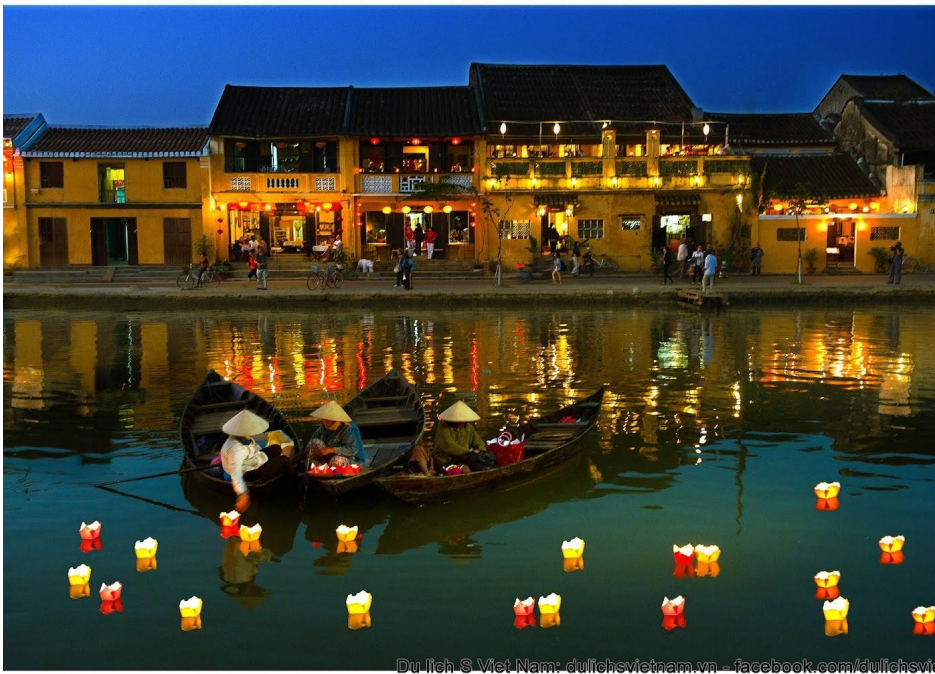
Dulich S Vietnam - dulichsvietnam.vn - facebook.com/dulichsvie