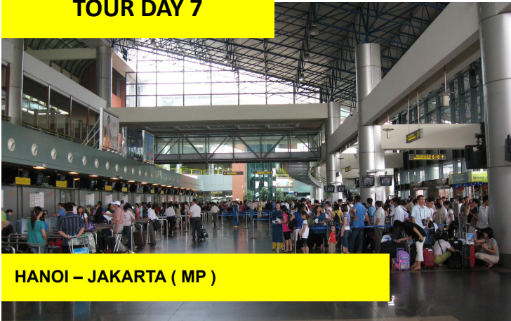
HANOI – JAKARTA ( MP )