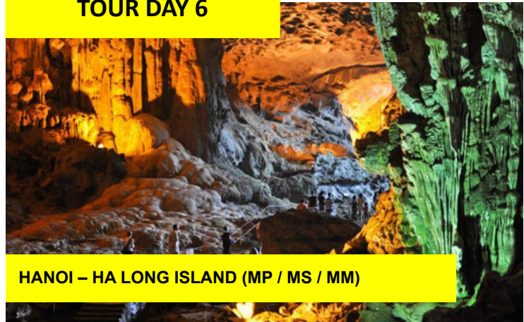
HANOI – HA LONG ISLAND (MP / MS / MM)