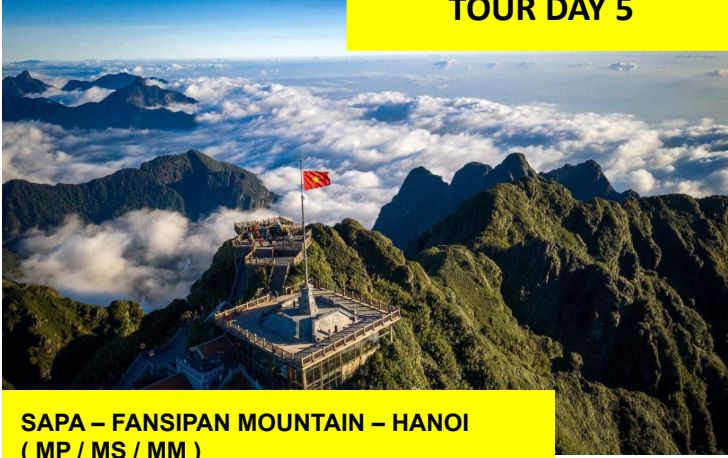
SAPA – FANSIPAN MOUNTAIN – HANOI ( MP / MS / MM )