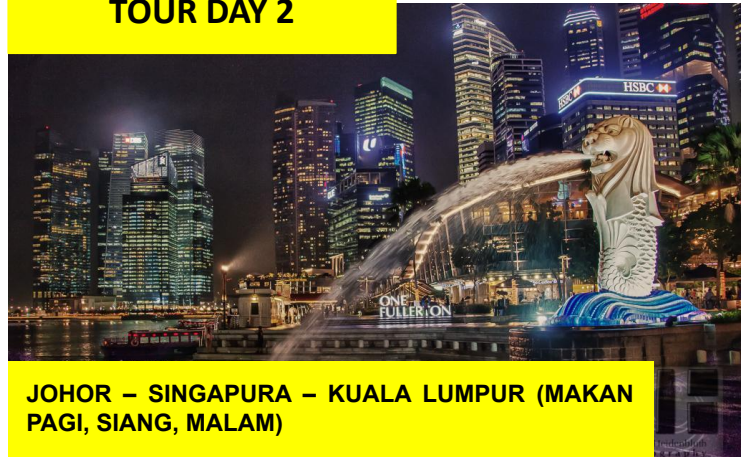
JOHOR – SINGAPURA – KUALA LUMPUR (MAKAN PAGI, SIANG, MALAM)