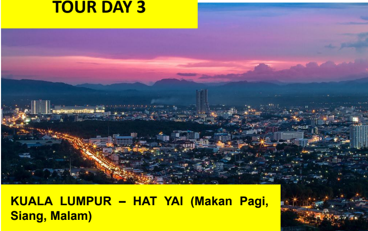
KUALA LUMPUR – HAT YAI (Makan Pagi, Siang, Malam)