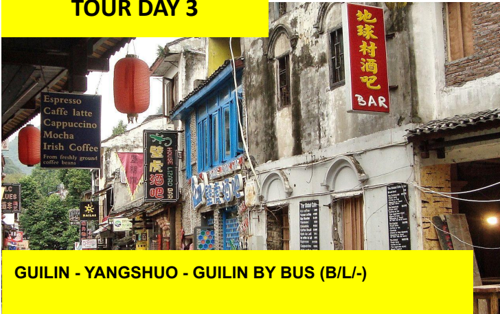
GUILIN - YANGSHUO - GUILIN BY BUS (B/L/-)