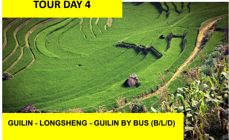
GUILIN - LONGSHENG - GUILIN BY BUS (B/L/D)