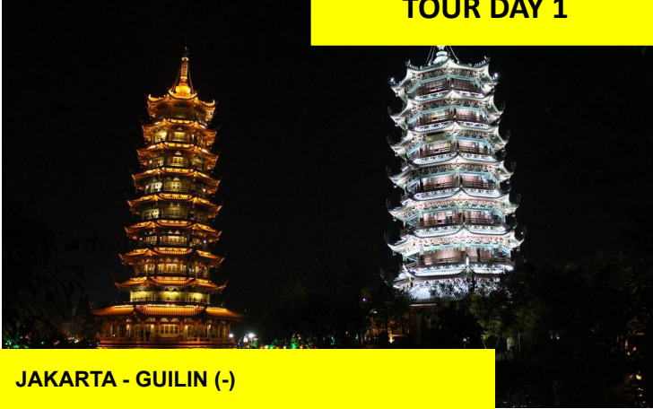
JAKARTA - GUILIN (-)