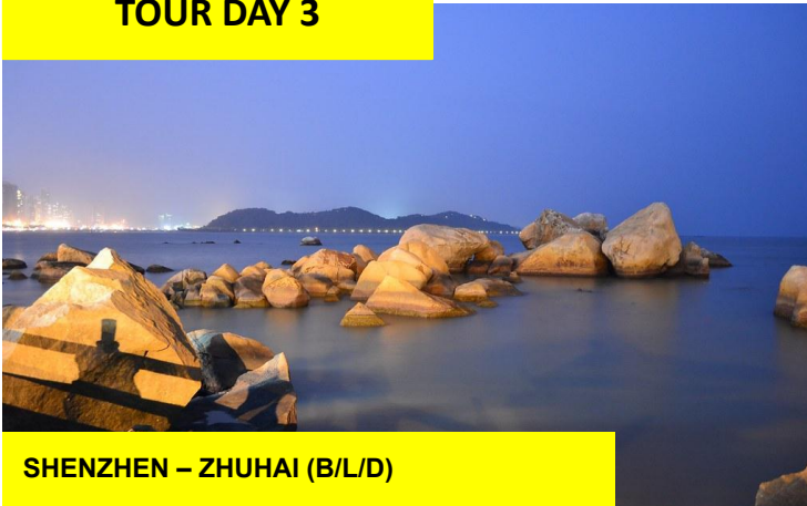
SHENZHEN – ZHUHAI (B/L/D)