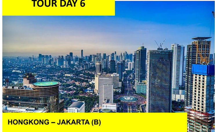
HONGKONG – JAKARTA (B)