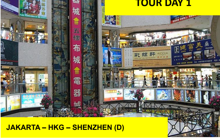
JAKARTA – HKG – SHENZHEN (D)