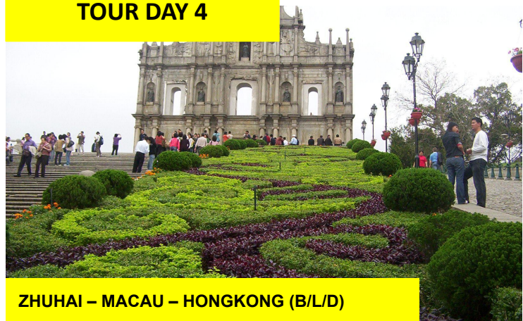
ZHUHAI – MACAU – HONGKONG (B/L/D)