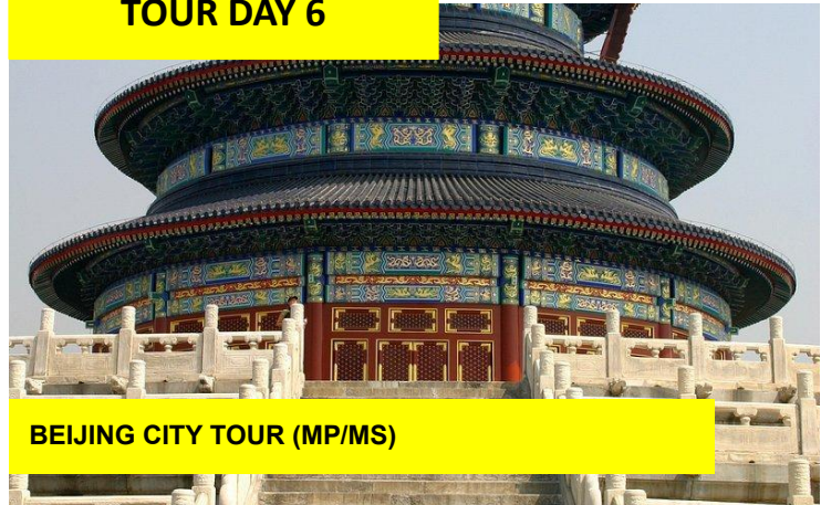
BEIJING CITY TOUR (MP/MS)