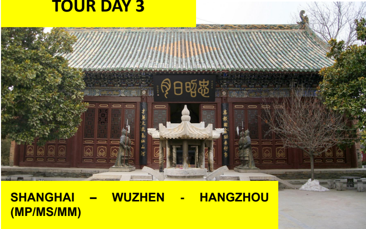
SHANGHAI – WUZHEN – HANGZHOU (MP/MS/MM)