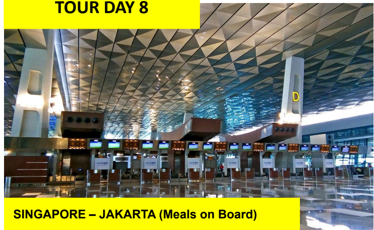
SINGAPORE – JAKARTA (Meals on Board)