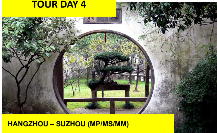
HANGZHOU – SUZHOU (MP/MS/MM)