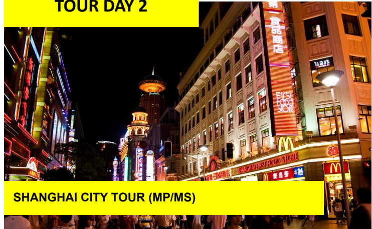
SHANGHAI CITY TOUR (MP/MS)