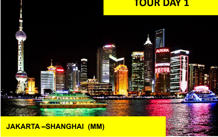
JAKARTA – SHANGHAI (MM)