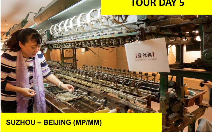
SUZHOU – BEIJING (MP/MM)