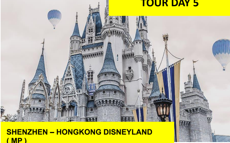
SHENZHEN – HONGKONG DISNEYLAND ( MP )