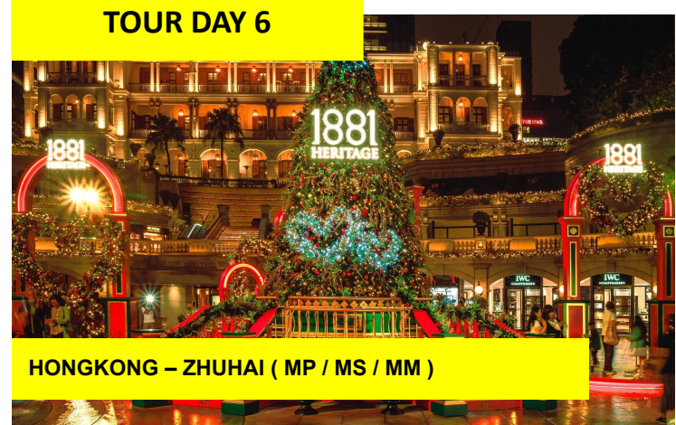
HONGKONG – ZHUHAI ( MP / MS / MM )