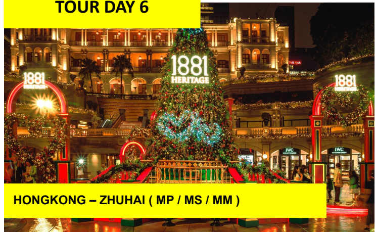
HONGKONG – ZHUHAI ( MP / MS / MM )