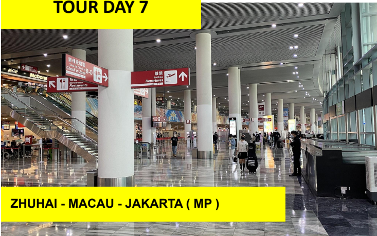
ZHUHAI - MACAU - JAKARTA ( MP )