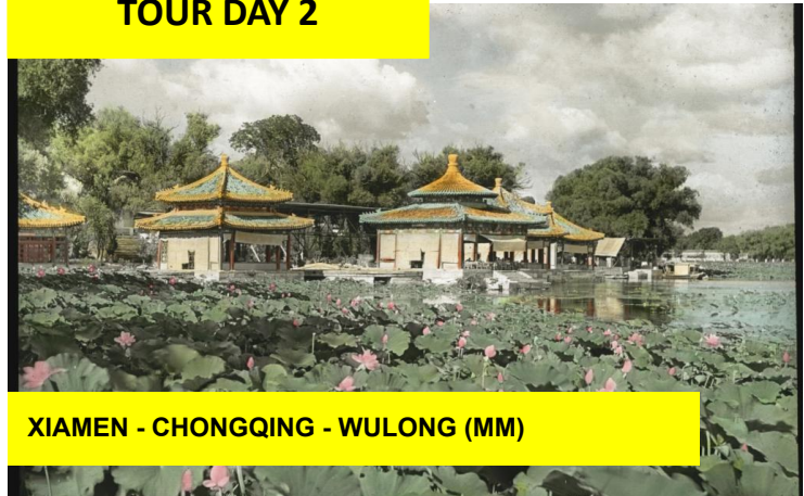
XIAMEN - CHONGQING - WULONG (MM)