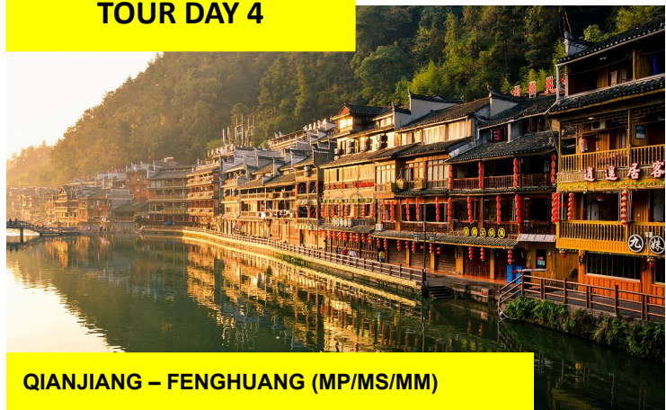
QIANJIANG – FENGHUANG (MP/MS/MM)