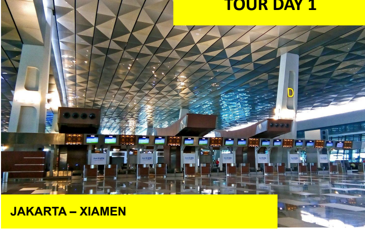
JAKARTA – XIAMEN