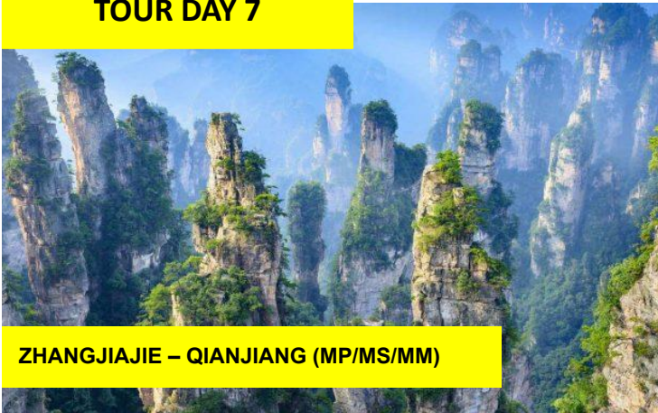
ZHANGJIAJIE – QIANJIANG (MP/MS/MM)