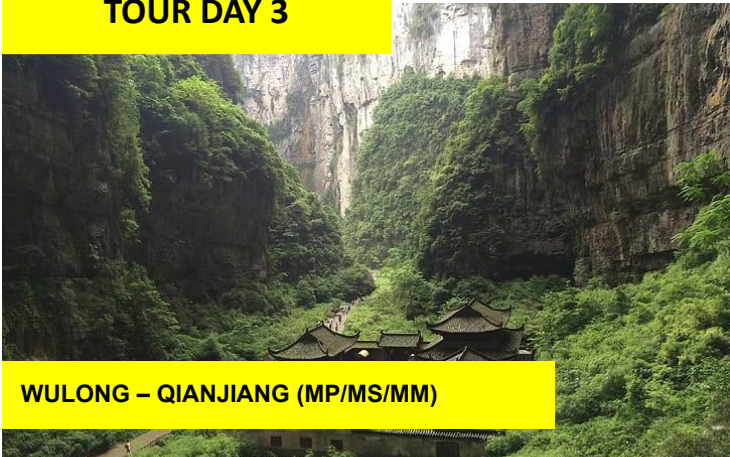
WULONG – QIANJIANG (MP/MS/MM)