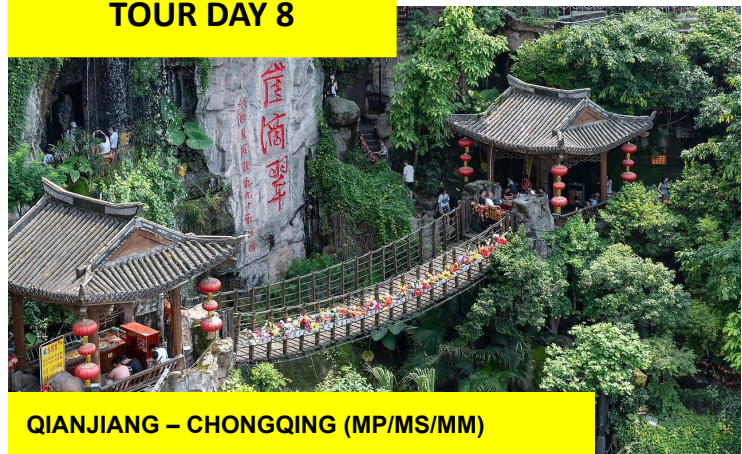
QIANJIANG – CHONGQING (MP/MS/MM)