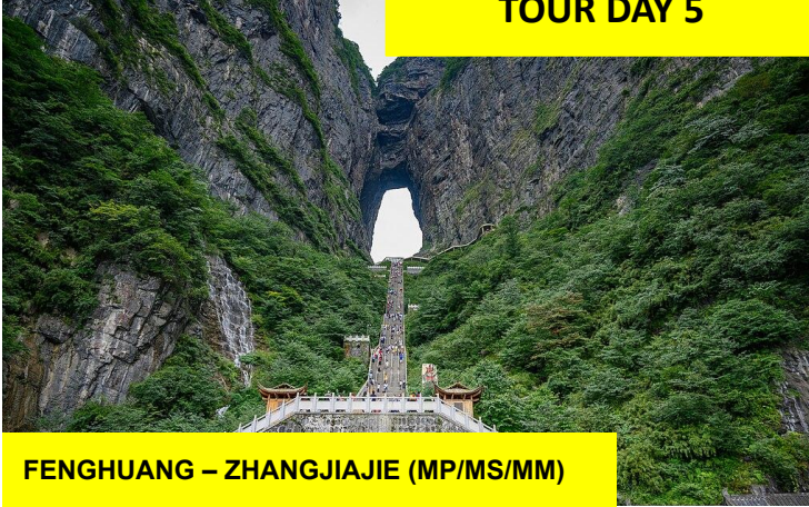
FENGHUANG – ZHANGJIAJIE (MP/MS/MM)