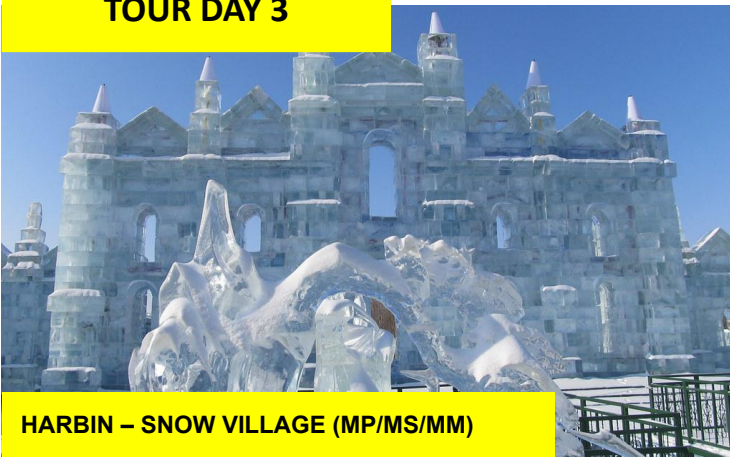
HARBIN - SNOW VILLAGE (MP/MS/MM)