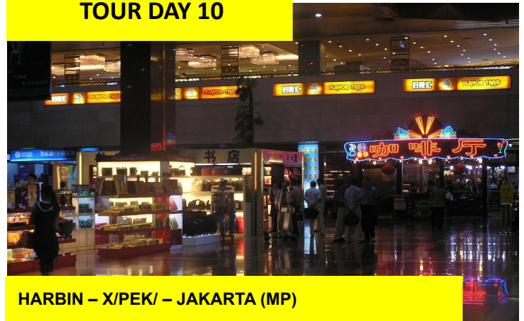
HARBIN – X/PEK/ – JAKARTA (MP)