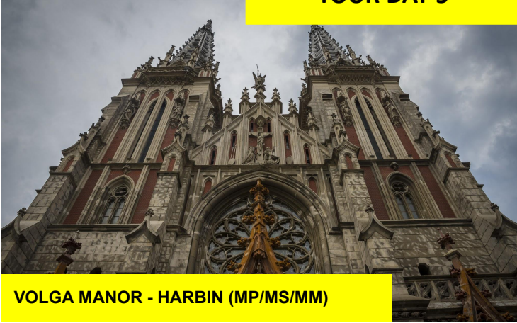
VOLGA MANOR - HARBIN (MP/MS/MM)