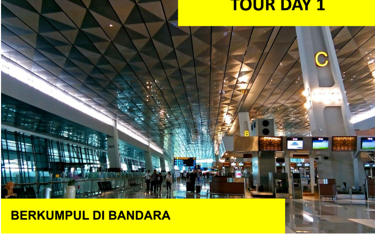
BERKUMPUL DI BANDARA