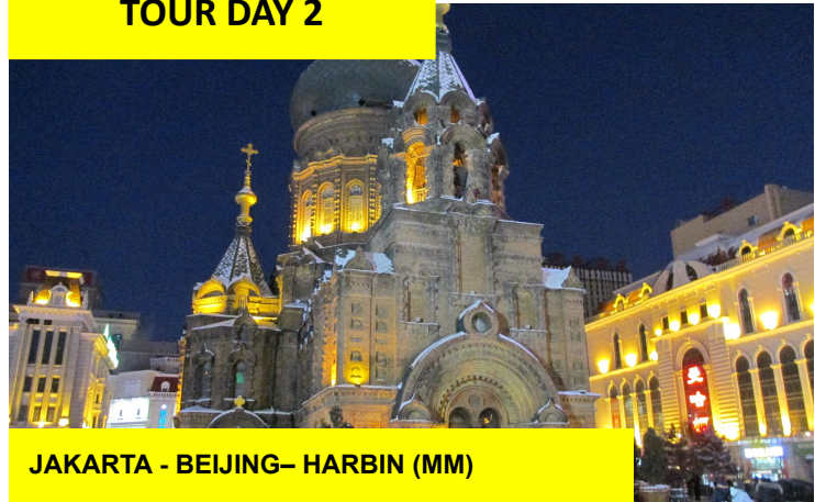
JAKARTA - BEIJING- HARBIN (MM)