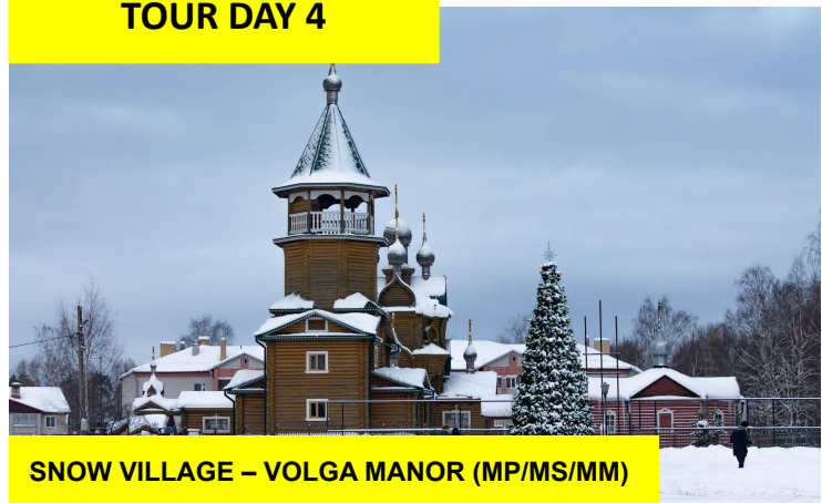
SNOW VILLAGE - VOLGA MANOR (MP/MS/MM)